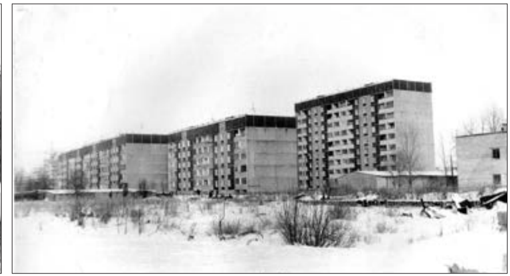
Дома № 9 Б, 9 В, 9 Г на ул. Рощинская. 1997 г.