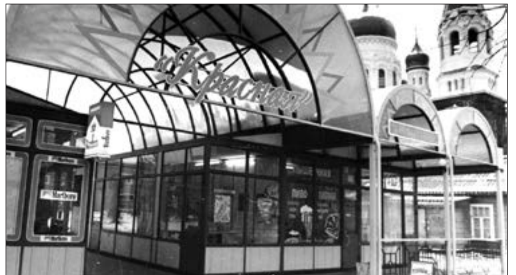
Торговый павильон «Красная». 2001 г.