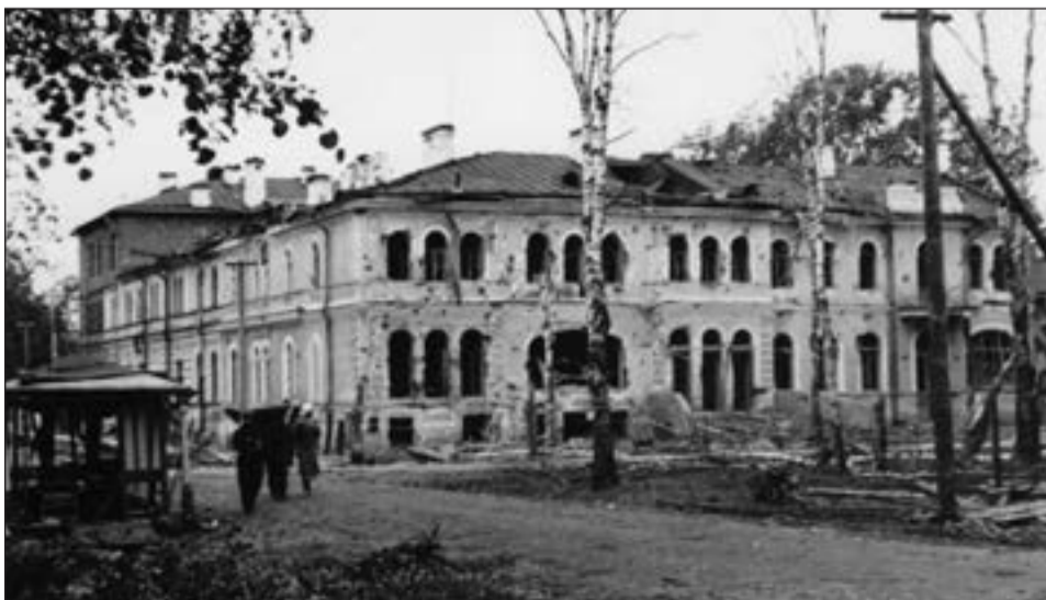
Здание Дома Красной Армии (быв. Общественного собрания) на месте нынешней Театральной площади. 1942 г.