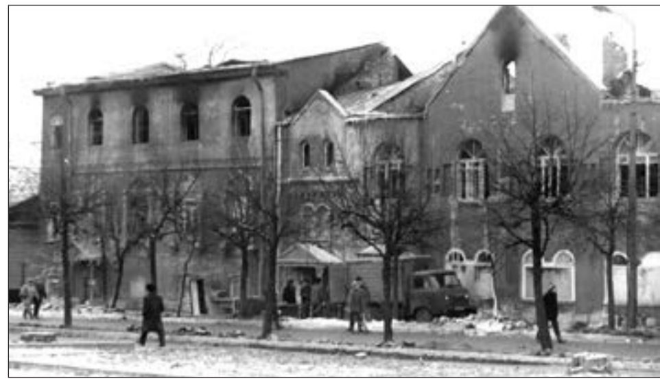
Ул. Красная, 8. Здание следственного комитета после пожара. 24 ноября 1993 года.